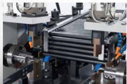
エアシリンダーチャッキング方式