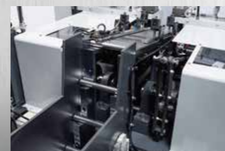
材料供給機(ホッパー)