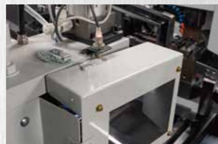
切削部カバー(安全装置 開時運転停止)