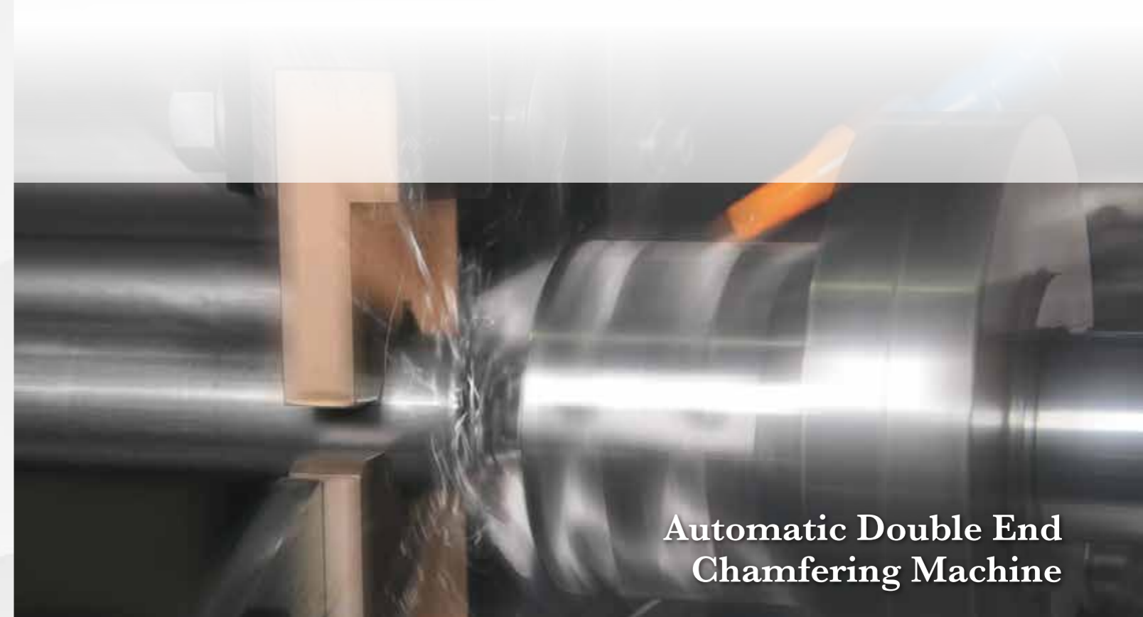
Automatic Double End Chamfering Machine