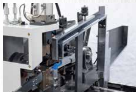
ユニット一体型材料シューター